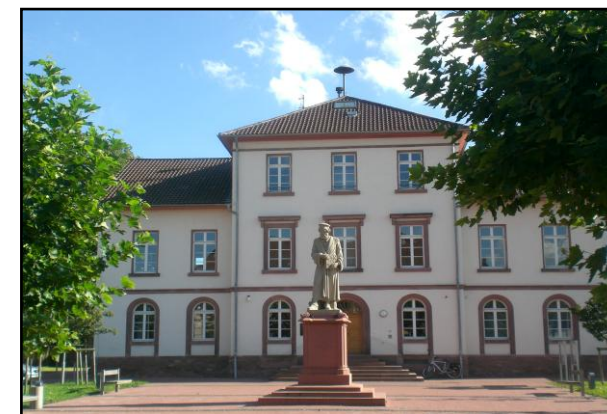
Peter-Schöffer-Haus Museum der Stadt Gernsheim

Tel: 06258 / 90 589 35 · Fax: 06258 / 90 31 52 www.vgh-ried.info